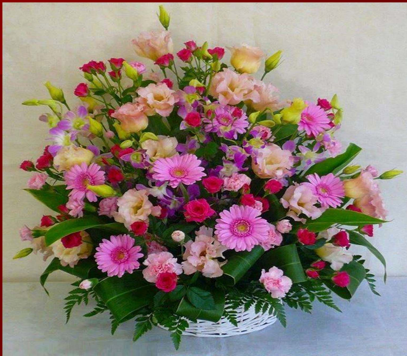
XIX. Szigetelésdiagnosztikai Konferencia 2019. október 16-18. Mátraháza